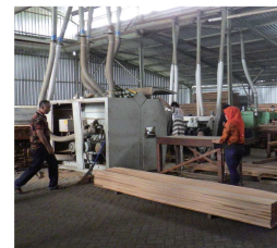
写真 1：C 社の様子